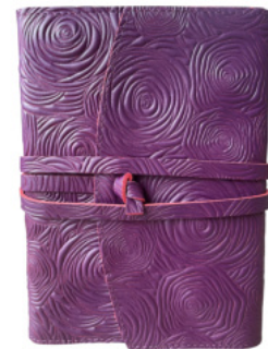
2445 Notizbuch ca. DIN A6 mit Bändchen 9916 Ersatzbuch DIN A6 2446 Notizbuch ca. DIN A5 mit Bändchen 9917 Ersatzbuch DIN A5