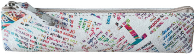
1770 Schlamerpetui mit Boden, mini

Bei dem Leder der Serie NEWS MULTI handelt es sich um Veloursleder, das mit einem speziellen Verfahren bedruckt wird und auf diese Weise einen außergewöhnlichen Look erhält.