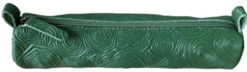
2434 Schlamperrolle, 19 x 5cm

Als Basis der Serie ROSA TEA dient ein softes Vollrindleder, das mit einer Rosenoptik geprägt wird.