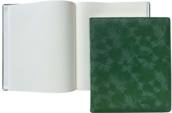
2438 Gästebuch, 25,5 x 21,5cm, 96 Blatt