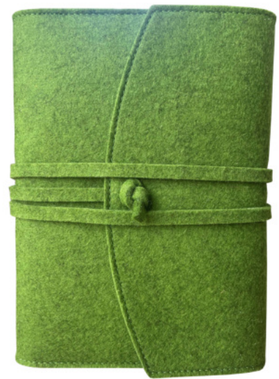
3386 Notizbuch ca. DIN A5 mit Bändchen 9917 Ersatzbuch DIN A5