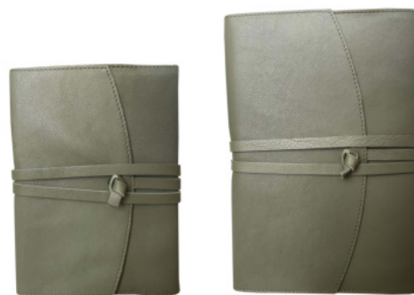
1225 Notizbuch ca. DIN A6 mit Bändchen