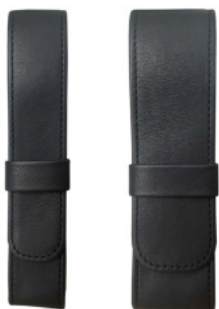
1211 Füller-Stecketui, 1tlg.

Bei dem Leder der Serie HORUS CF handelt es sich um ein Vollrindleder mit einem sehr natürlichen anilinen Finish und einem angenehm weichen Griff. Das Leder ist chromfrei und rein pflanzlich gegerbt.