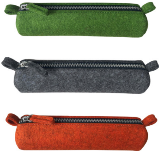
3384 Schlamperrolle, 19 x 5cm