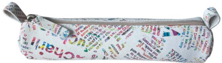
1771 Schlamerrolle klein, 18,5 x 4cm