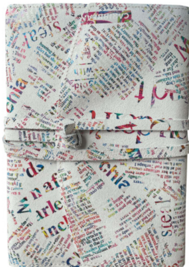
9917 Ersatzbuch DIN A5