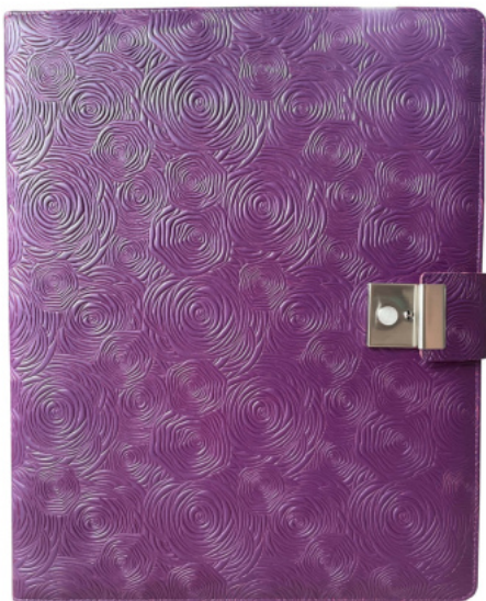
2443 Dokumentenmappe ca. DIN A4, Folioformat 9913 Dokumentenhülle